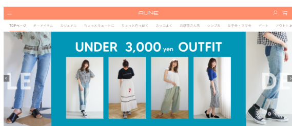
新たにオープンした【ECサイト】

バロック社は、女性向けアパレルブランドを主軸として、MOUSSY、SLYなど17ブランド(この度のセキュリティコンサルティング対象となるECサイトAUNEはそのうち複数のブランドを取り扱う予定)を展開している製造小売り企業です。2020年2月末時点、日本に356店舗、2019年12月末時点、中国に285店舗、その他海外5店舗を保有しており、自社ECサイトを開発、運営しております。一方、CAICAテクノロジーズは、世界大手のシステムインテグレーターのコアパートナーとして長年にわたり、インフラ関連全般の設計・導入・運用・保守を行う「基盤インフラ」業務を手掛けて参りました。また、仮想通貨交換所などのセキュリティを担当するなど、昨今、重要度が増しているインターネットセキュリティ業務を積極的に展開しております。